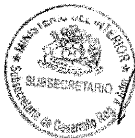
RICARDO CIFUENTES LILLO SUBSECRETARIO DE DESARROLLO REGIONAL Y ADMINISTRATIVO