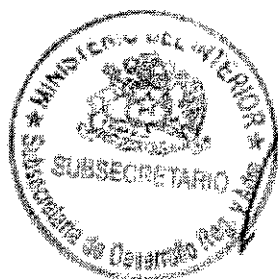
RICARDO CIFUENTES LILLO SUBSECRETARIO DE DESARROLLO REGIONAL Y ADMINISTRATIVO