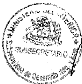
RICARDO CIFUENTES LILLO SUBSECRETARIO DE DESARROLLO REGIONAL Y ADMINISTRATIVO