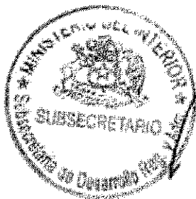
RICARDO CIFUENTES LILLO SUBSECRETARIO DE DESARROLLO REGIONAL Y ADMINISTRATIVO