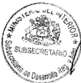
RICARDO CIFUENTES LILLO SUBSECRETARIO DE DESARROLLO REGIONAL Y ADMINISTRATIVO