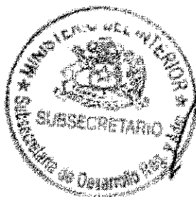
RICARDO CIFUENTES LILLO SUBSECRETARIO DE DESARROLLO REGIONAL Y ADMINISTRATIVO