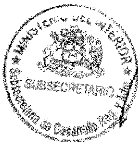
RICARDO CIEJENTES LILLO SUBSECRETARIO DE DESARROLLO REGIONAL Y ADMINISTRATIVO