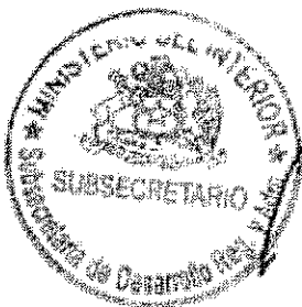
RICARDO CIFUENTES LILLO SUBSECRETARIO DE DESARROLLO REGIONAL Y ADMINISTRATIVO