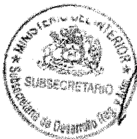
RICARDO CIFUENTES LILLO SUBSECRETARIO DE DESARROLLO REGIONAL Y ADMINISTRATIVO