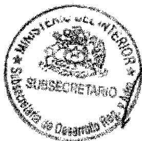
RICARDO CIFUENTES LILLO SUBSECRETARIO DE DESARROLLO REGIONAL Y ADMINISTRATIVO