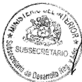
RICARDO CIFUENTES LILLO SUBSECRETARIO DE DESARROLLO REGIONAL Y ADMINISTRATIVO